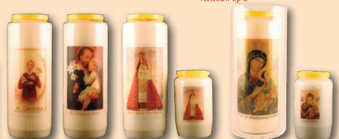
5378-60 H. Gerardus 5378-61 Jozef en Jezus 5378-62 Zoete Moeder 5382-62 5378-01 in noveenglas 5382-01