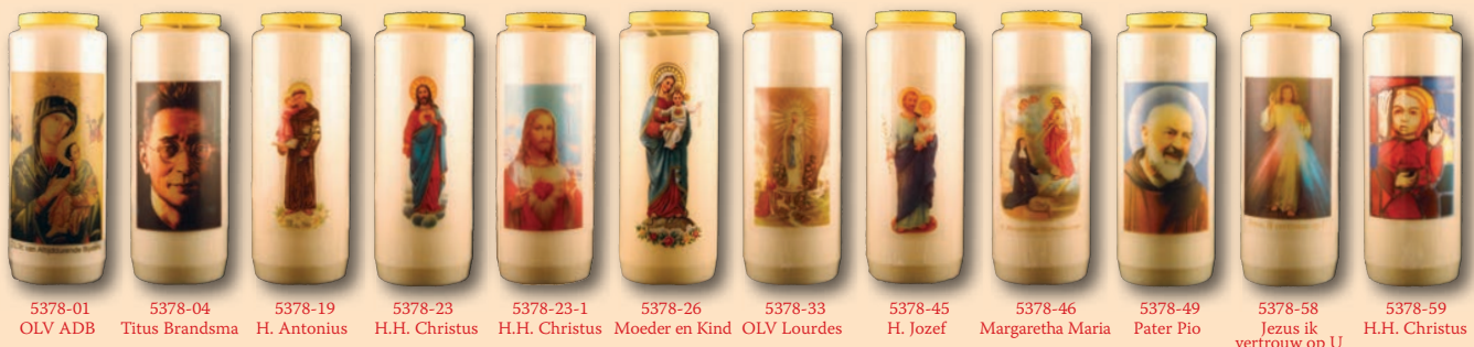
5378-01 OLV ADB 5378-04 Titus Brandsma 5378-19 H. Antonius 5378-23 H.H. Christus 5378-23-1 H.H. Christus 5378-26 Moeder en Kind 5378-33 OLV Lourdes 5378-45 H. Jozef 5378-46 Margaretha Maria 5378-49 Pater Pio 5378-58 Jezus ik vertrouw op U 5378-59 H.H. Christus

(Geproduceerd volgens voorschriften van het Vaticaan)